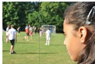
„Sport nach 1“