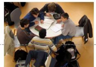
„ Behaimer helfen Behaimern “